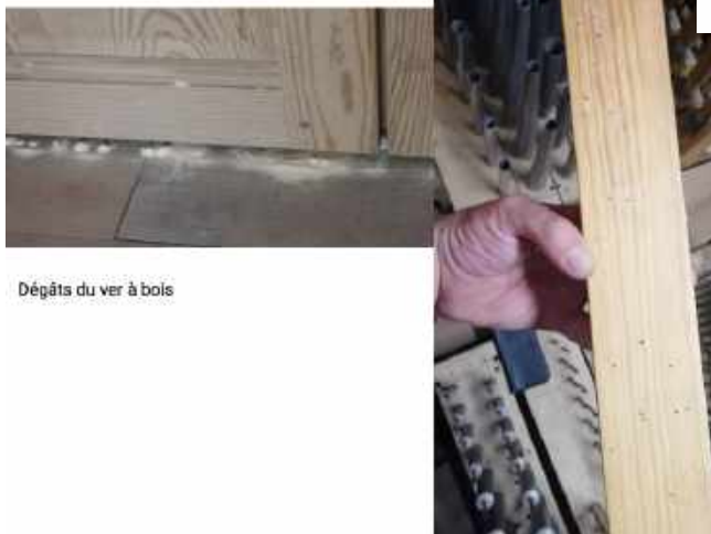
Dégâts du ver à bois

Les peaux du soufflet qui elles, sont encore dans un bon état, seront simplement nettoyées et traitées à l'huile de vaseline.